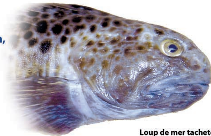
Loup de mer tacheté

Faites attention lorsque vous les remettez à l'eau.